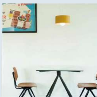
ペンダントライト GALLON/1P W270×D270×H135mm ¥10,450 (税込)