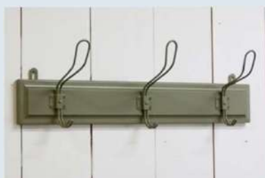
ツールバー スリフックグリーン (外寸)約W600×D170×H150mm ¥4,730 (税込)