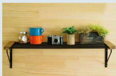
シェルフ アイアン×ウッドボード W75×D23×H2cm ¥6,600 (税込)