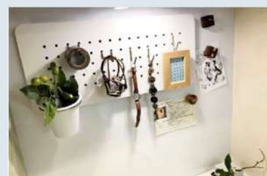
木製パネル有孔ボードレクタングル W450×H200×T5.5mm ¥6,050 (税込)