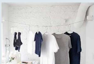
室内物干しロープ STOK laundry ¥5,280 (税込)