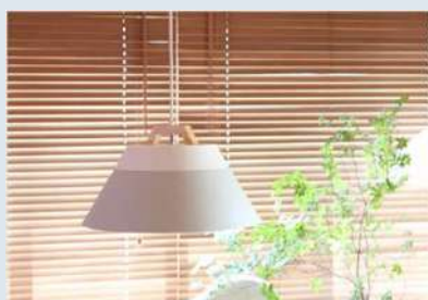
ペンダントライト LAMP by 2TONE 3BULB PENDANT LIGHT φ420×H230mm ¥19,580 (税込)