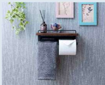
トイレトペーパーホルダー(ダブル) ¥6,578 (税込)

オリジナル家具をポイントで入れるだけでおしゃれな雰囲気・・・写真はほんの一例です。 注文・設置もお任せください！