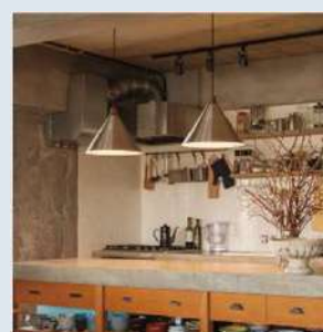
ペンダントライト B-TOM W370×D370×H290mm ¥16,280 (税込)